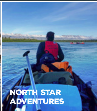
NORTH STAR ADVENTURES